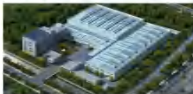
新建厂房、智能装备研发中心及配套用房项目（变更）-车间部分