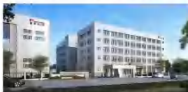
智能型自控闸门执行器制造基地 - 生产车间