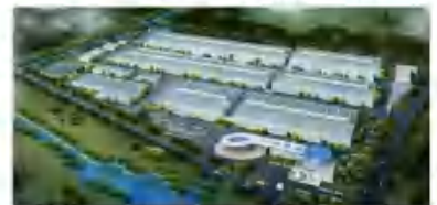
2# 车轮联合厂房项目