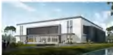
江南大学体育训练馆（风雨操场）项目