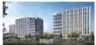
联东U谷无锡江苏智造科技园项目