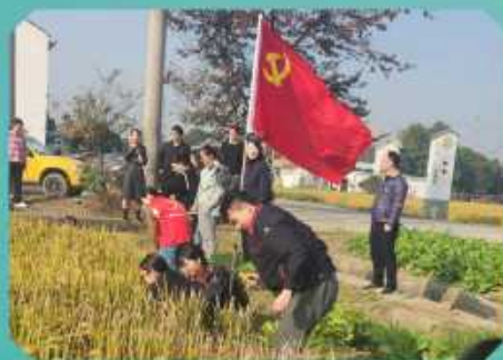
新时代文明实践站（泾西村）与文明单位结对共建活动