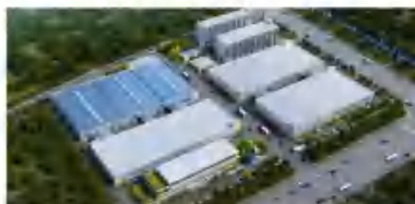
汽车零部件、连接器、紧固件的研发、生产与销售项目（二期） -2#生产车间（南）